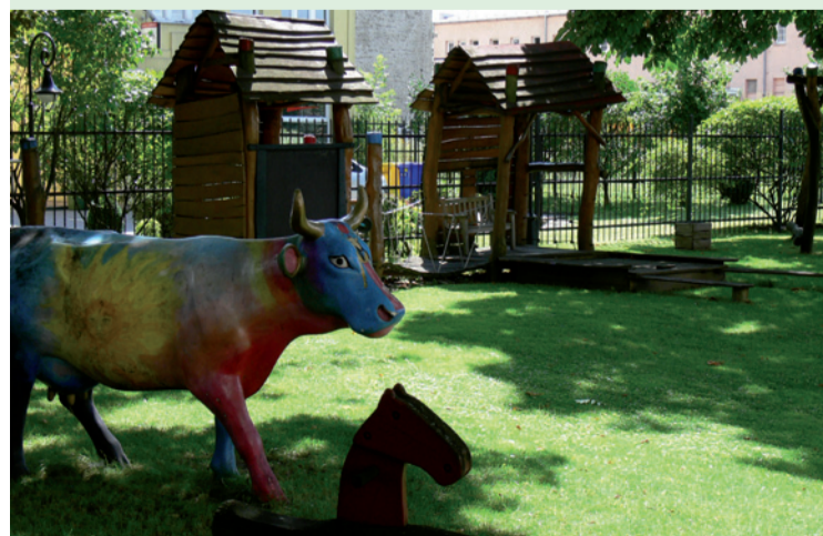
Soukromé dětské hřiště na pronajatém pozemku. Zastupitelstvo města Ostravy jeho prodej neschválilo.