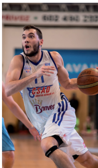
Basketbalisté NH hráli v loňské sezoně vždy před zaplněnou halou.

Basketbalová Ostrava byla v uplynulé sezoně v jednom ohledu úplně první. Začala vysílat přenosy z domácích zápasů společně